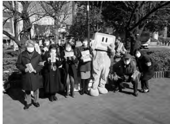
寒風に負けずに頑張りました！