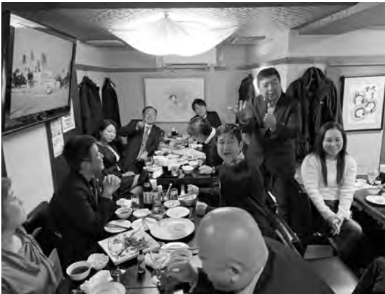
開始2時間すっかり打ちとけました