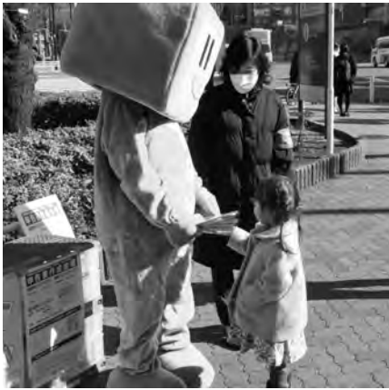
いつでも大人気のイータ君

署がご用意くださった一億円のレプリカに足を止める方もいて三十分余りで活動を終わりました。